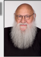
9 - Bauchem