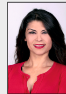
16 - Waurichen / Prummern