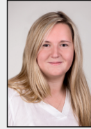
8 - Bauchem