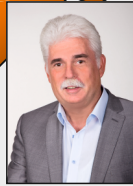
11 - Gillrath / Nierstraß / Panneschopp