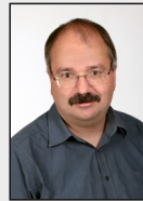
7 - Geilenkirchen