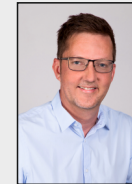
15 - Immendorf / Apweiler