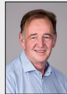
4 - Geilenkirchen