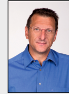
19 - Lindern