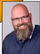
14 -Fliegerhorstsiedlung / Sisbenden / Grotenrath