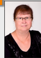
1 - Hünshoven