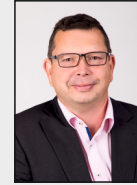
18 - Würm / Leiffarth / Müllendorf / Honsdorf / Flahstraß