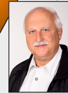
5 - Kraudorf / Nirm / Hoven / Kogenbroich / GK