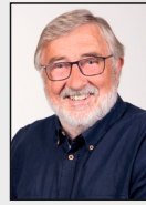
3 - Geilenkirchen