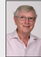
17 - Beeck / Süggerath