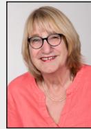
6 - Bauchem