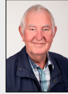
10 - Niederheid / Hochheid / Tripsrath / Rischden