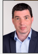
12 - Gillrath / Hatterath