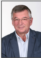
13 - Teveren